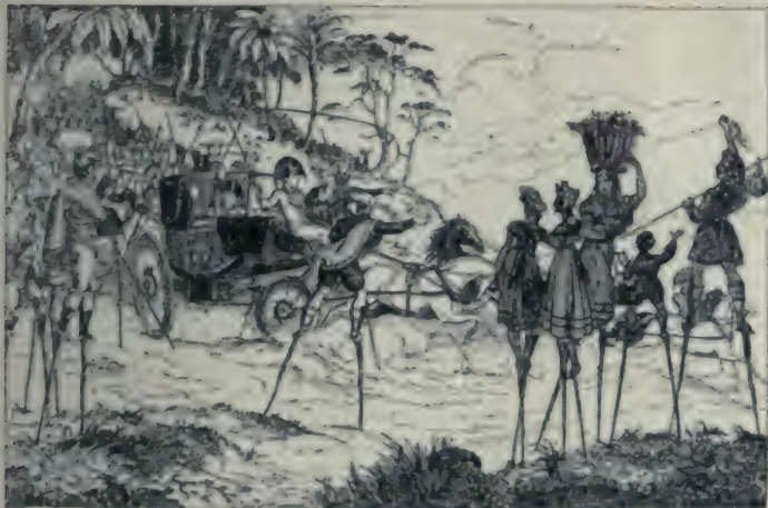
La garde d'honneur des paysans bayonnais.

Caricature anglaise. (Bibliothèque Nationale. Estampes.)